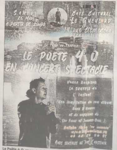
Le Poète 4.0, un spectacle à découvrir samedi 26 mars, au Café Le Gueulard, à Nilvange.

Renseignements au 03 82 85 50 71 ou info@le-gueulard.fr